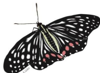
アカボシゴマダラ